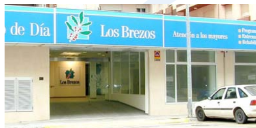
Acceso interior vehículos